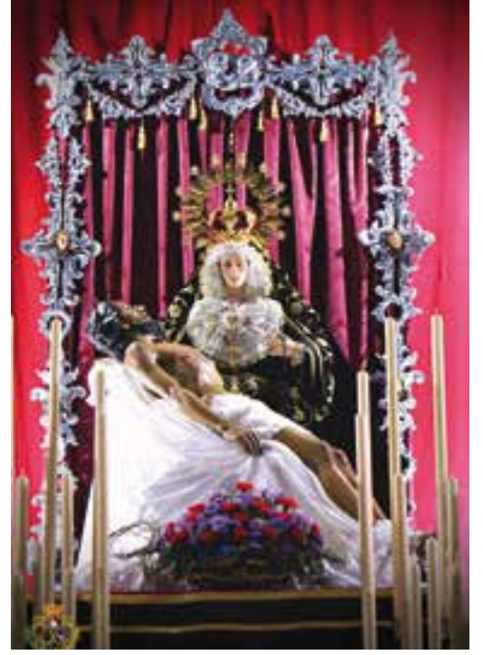
Yacente y Virgen de los Dolores