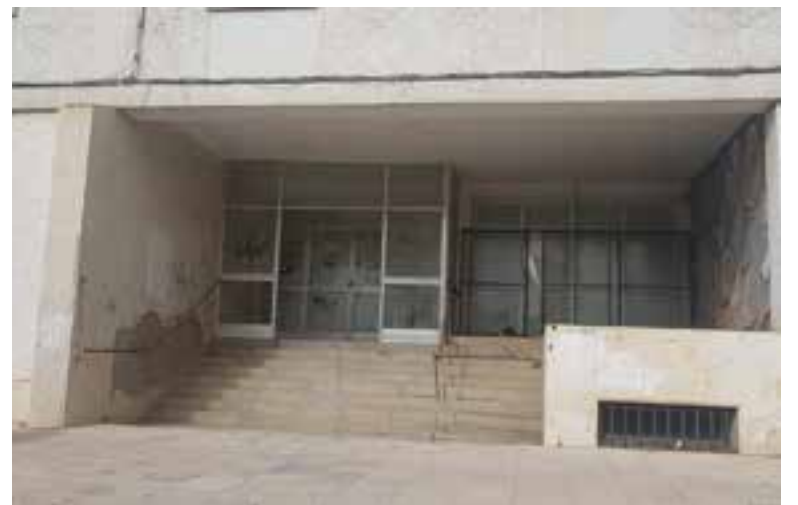
Fachada del antiguo ambulatorio

al municipio de unas instalaciones de este tipo que sean capaces de congregarse un vivero de empresas por tanto generar riqueza hemos generado un proyecto que se ha presentado a una convocatoria pública de ayudas", y añadió que "por ese motivo desde el Ayuntamiento hemos solicitado a la Tesorería General de la Seguridad Social, el cambio de uso del antiguo ambulatorio informándoles que no lo vamos a usar como centro cívico, si no que la intención es darle un centro empresarial como centro promotor de iniciativa empresarial, para conseguir ese cambio de uso la Tesorería General de la