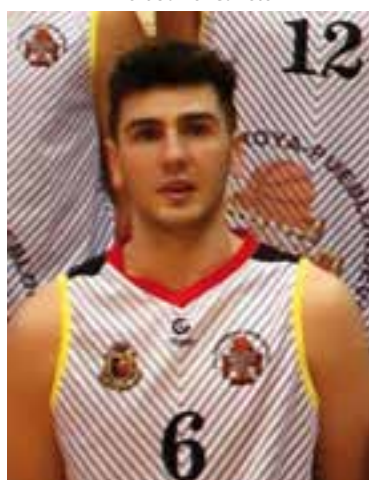
Base Rafa Sanchez