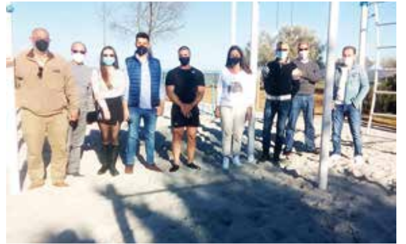
Acto de inauguración de el parque

desarrolla una mejor salud mental. También hay que destacar los beneficios propios de la práctica de este deporte, como el aumento de la resistencia física y la mejora de los movimientos cotidianos, además previene el desarrollo de desequilibrios musculares ya que se logra mejorar la postura corporal y también facilita la socialización. Los aparatos que componen el parque son paralelas triples, espaldaderas, anillas, barras bajas, cuerda, flexiones, barra alta y banco, pórtico, escalera inclinada y dominadas.