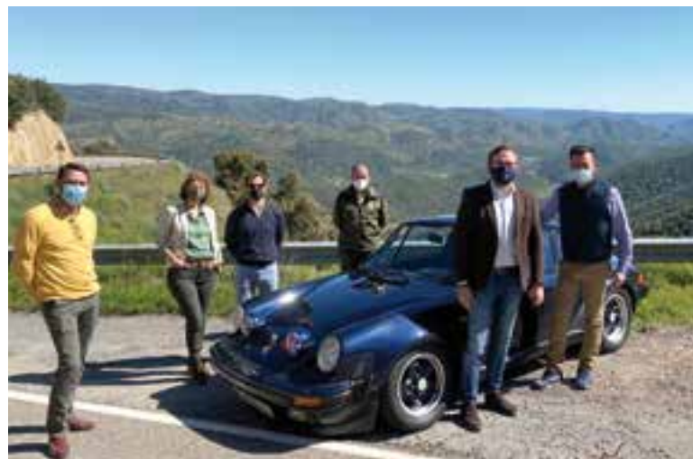
Acto de presentación de la edición de 2021 del Rallye de Sierra Morena

Para el delegado, "la organización de la prueba veterana de rallye de asfalto en la provincia, ha sido diseñada barajando todas las opciones