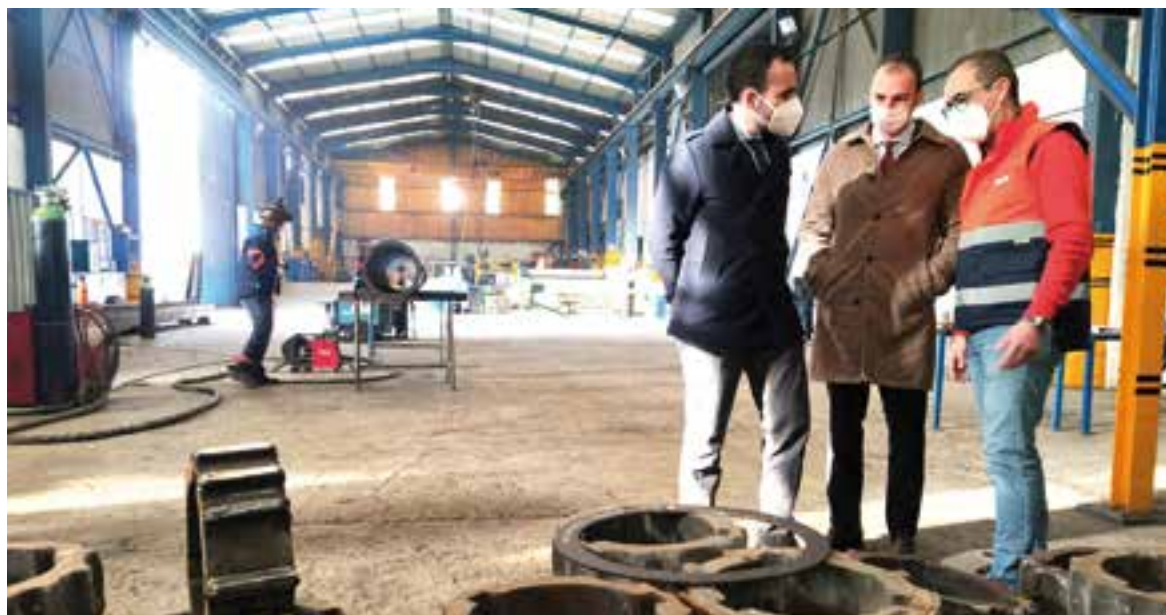
Herrador visitando las instalaciones de MECAVI

Mecanización y Calderería Villaharta se dedica a la fabricación, montaje y mantenimiento de instalaciones industriales, alcanzando un volumen de facturación de 10 millones de euros. Líder en el sector de la calderería y de los mecanizados, ofrecen un servicio integral a sus clientes industriales que va desde la fabricación de una pieza concreta o la realización de equipos mecánicos completos y elementos industriales de gran envergadura tales como estructuras, tubería, equipos a presión y todo tipo de calderería tanto pesada como ligera. Además, realizan el montaje y mantenimiento de todo tipo de instalaciones industriales.