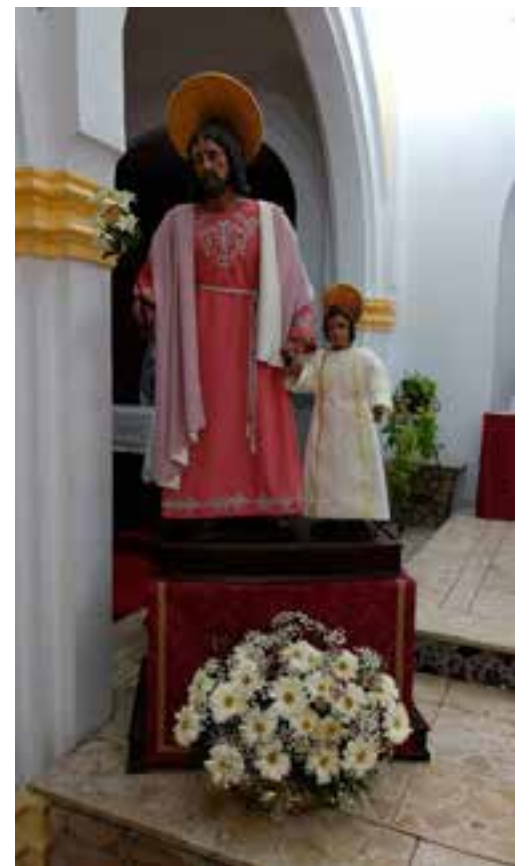
Imagen de San José con su nueva saya