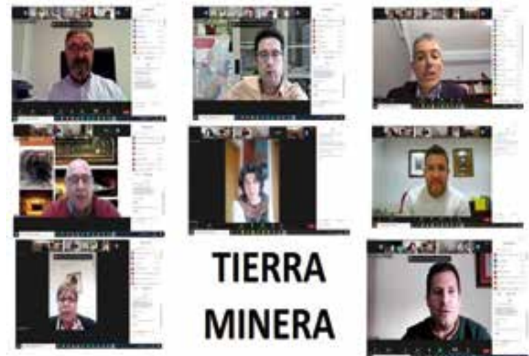
Asistentes a la primera reunión

El proyecto pretende lograr sus objetivos con la ejecución de seis líneas estratégicas a la que se une la de coordinación en el territorio y coordinación común, desarrolladas a través de 22 acciones concretas, que a su vez se pueden desmenuzar