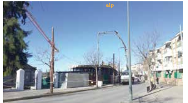
Instalaciones de Fray Albino junto a la obra del nuevo centro de Mercadona