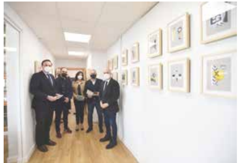
Acto de inauguración del espacio expositivo de la EPSB