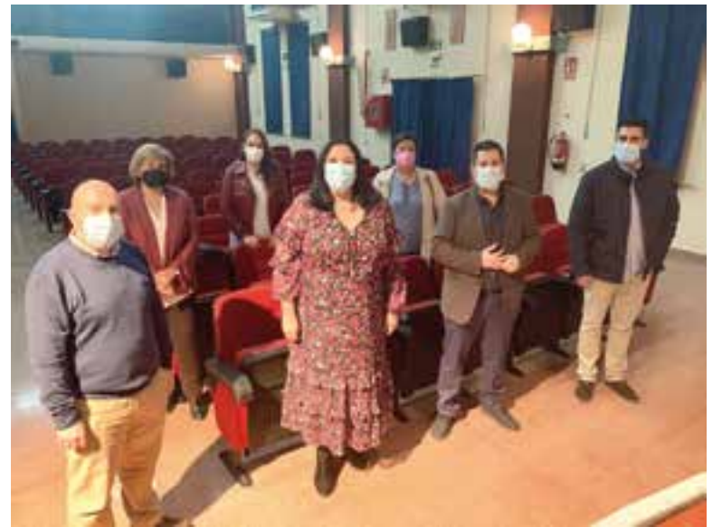
Amo visitando algunas de las actuaciones realizadas con el programa de Acción Concertada

Amo abundó en que "a todo ello se suman otros programas ejecuta-