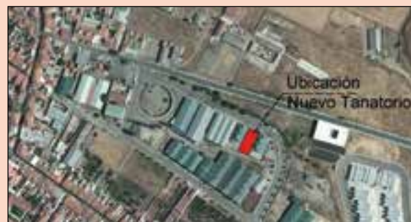
Próxima apertura Tanatorio de Belmez