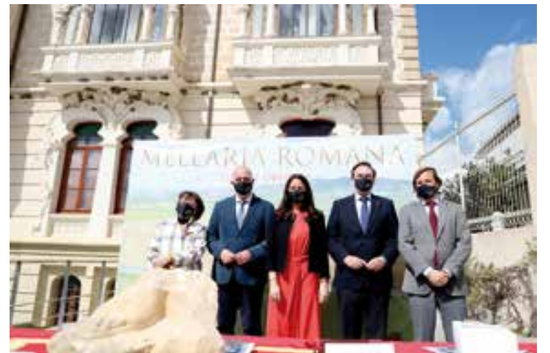
La firma de un convenio permitirá el estudio de esta zona

La vía, objeto de análisis, parte de Córdoba hacia Augusta Emérita