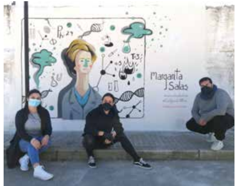
Mural de Margarita Salas en Belmez

La actividad está incluida en el VII Plan Anual de Divulgación Científica de la Universidad de Córdoba, financiado por la Fundación Española para la Ciencia y la Tecnología (FECYT). La iniciativa, con la que colabora la Diputación de Córdoba, se enmarca dentro de una línea estratégica de divulgación en la provincia con la que se pretende comunicar la ciencia a través de nuevos formatos cercanos y accesibles para la ciudadanía.