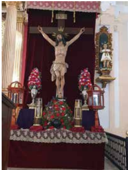
Cristo de la Expiración

El Viernes de Dolores, 26 de marzo, permaneció todo el día abierta la Parroquia y se bendijo la restauración de la antigua túnica de Ntro. Padre Jesús Nazareno y el bordado que lleva.