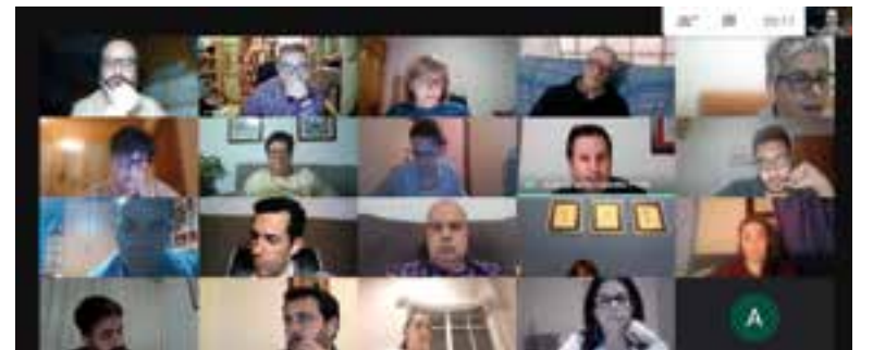
Pleno en el que se aprobó la firma del convenio para seguir perteneciendo al Club Patrimonio