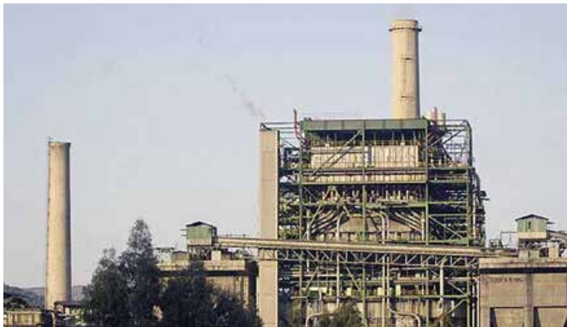
Instalaciones de Puente Nuevo

Velasco destacó que "estos protocolos constituyen un paso decisivo para fijar los objetivos estratégicos y definir las actuaciones concretas que han de llevarse a cabo para promover el crecimiento económico sostenible, el bienestar social y el empleo en estos territorios". Según ha remarcado el titular de Transformación Económica, esta firma constituye para los agentes económicos y sociales de la zona y para sus ciudadanos "una garantía de que todo este proceso se hará con el