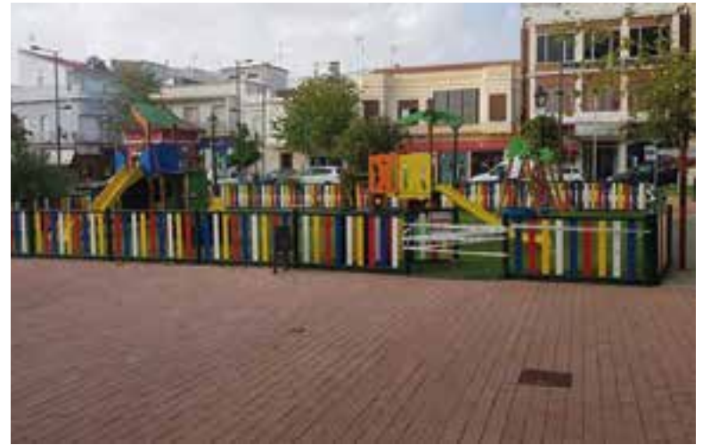
Una de las zonas que van a contar con red wifi

En el procedimiento de licitación se van a valorar diferentes aspectos para determinar el mejor proyecto para el municipio. Concretamente, además de valorar la propuesta económica, se tendrán en cuenta las mejoras planteadas por las dis-