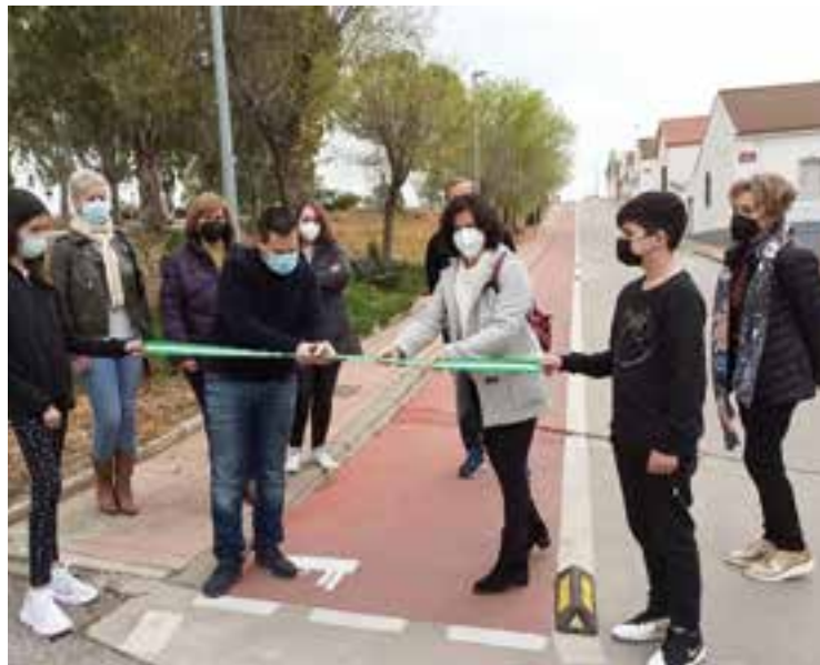
Acto de inauguración del carril bici

Con este acto se culminan 3 meses de trabajo en el que han participado 23 alumnos y alumnas del IES Alto Guadiato y numerosos profesores de este centro. La vía ciclista ha tenido un coste de 5.400 euros y se han creado dos empleos durante su ejecución, que se han adjudicado a dos jóvenes con experiencia en gestión sociocultural y actividades en la naturaleza. El 100% de la inversión ha sido realizado por el Plan Impulsa de la Consejería de Educación de la Junta de Andalucía, un programa puesto en marcha por el actual gobierno andaluz con el objetivo de ampliar el horizonte educativo de algunas zonas de Andalucía, dentro de la cual la comarca del Guadiato tiene especial interés por su situación socioeconómica. El citado carril bici tiene una longitud de 1.300 metros y, por una parte, permite conectar la Vía Verde de Peñarroya-Pueblonuevo con la homónima de La Maquinilla a la altura del kilómetro 5,4 lo que supone superar una histórica discontinuidad entre estas dos infraestructuras que confundía y des-