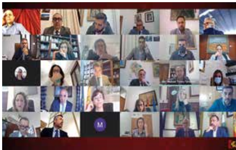
En el pleno se informó de vías en las que se va a actuar