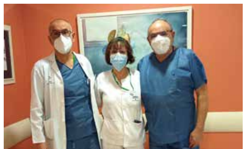
Profesionales del Área Sanitaria Norte premiados

la Unidad de anestesiología y Reanimación del Hospital Universitario Reina Sofía de Córdoba por el trabajo titulado "Estudio epidemiológico de la Fibrosis Glútea en el Área Sanitaria Norte de la provincia de Córdoba".