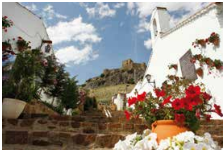
Belmez consiguió el primer Premio de Rincón Típico

"De este modo, al matiz turístico de este proyecto debemos sumarle el carácter cultural del mismo, ya que buscamos favorecer la puesta en valor de estos espacios, favoreciendo actividades turísticas en los