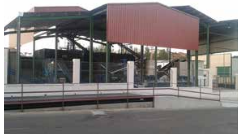
Instalaciones de Olivarera del Guadiato

Olivarera del Guadiato SCA trabaja desde hace años en la concentración la producción oleícola de la comarca, así como en el desarrollo de actividades de servicio al agricultor socio en varios centros, ubicados en otras localidades. Esta Cooperativa cuenta, actualmente, con centros de trabajo en Espiel y Villaharta, además de en Villaviciosa, ya que esta es la 4ª fusión que se ha llevado a cabo, tras la integración de las Cooperativas Olivareras de Espiel (2004) y Villaharta (2011), así como de la antigua Cooperativa Agrícola Exportadora de Vinos de Villaviciosa (donde se está desarrollando un interesante proyecto de elaboración de vinos de la tierra con Indicación Geográfica Protegida), por lo que tras esta integración de la Cooperativa de Belmez, Olivarera del Guadiato alcanza ya casi los 2000