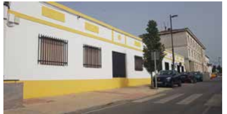
Fachada del local cedido a la Fundación